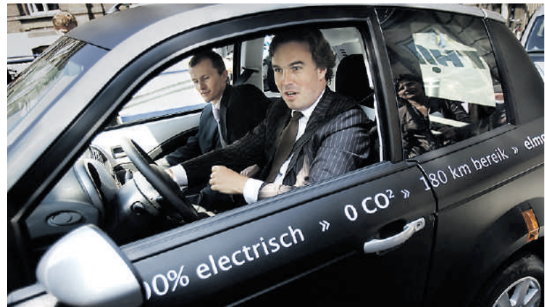
Minister Eurlings komt niet thuis met de Think.

Gelukkig was de kop boven het artikel over de elektrische auto Think pakkend: 'Kilometerreter Eurlings' ( Trouw , gisteren). Want om je zo een groen imago aan te meten is triest. Een elektrische auto is natuurlijk mooi. Maar wat vertelt Eurlings erbij? Dat hij helaas van Valkenburg naar Den Haag op en neer moet en dat deze auto daar dus niet geschikt voor is. Gewone ambtenaren krijgen een verhuisvergoeding om dichterbij hun werk te gaan wonen of te reizen met het ov. Maar gelukkig, zo stelt Eurlings, als je in de stad woont biedt deze auto wel een oplossing. Kennelijk komt het niet in hem op dat er in de stad nog veel betere voorzieningen voorhanden zijn, zonder oplaadtijd en met een onbeperkte actieradius: de fiets en het openbaar vervoer. Je mag hopen dat dit kabinet, dat duurzaamheid en milieu hoog in het vaandel heeft staan, deze minister erop aanspreekt. R.A. Zakke Bunnik