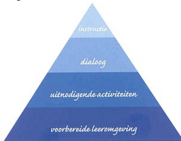
Figuur 1: de vier elementen, in hun onderlinge verhoudingen.

In dit vierde – en tevens laatste – artikel ga ik eerst nog wat dieper in op de voorbereide leeromgeving , vervolgens kijken we naar de rol van het curriculum in de school en ik eindig met de pedagogische basis van het geheel.